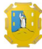
San Luis Potosí